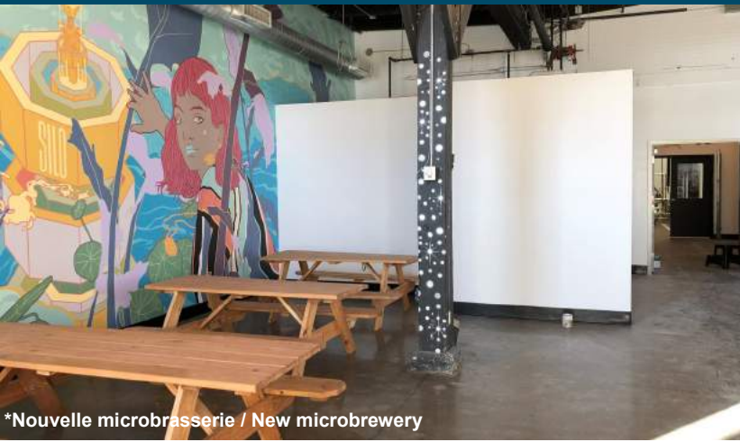
*Nouvelle microbrasserie / New microbrewery