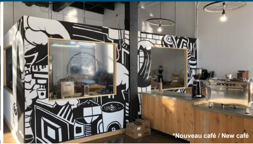
*Nouveau café / New café