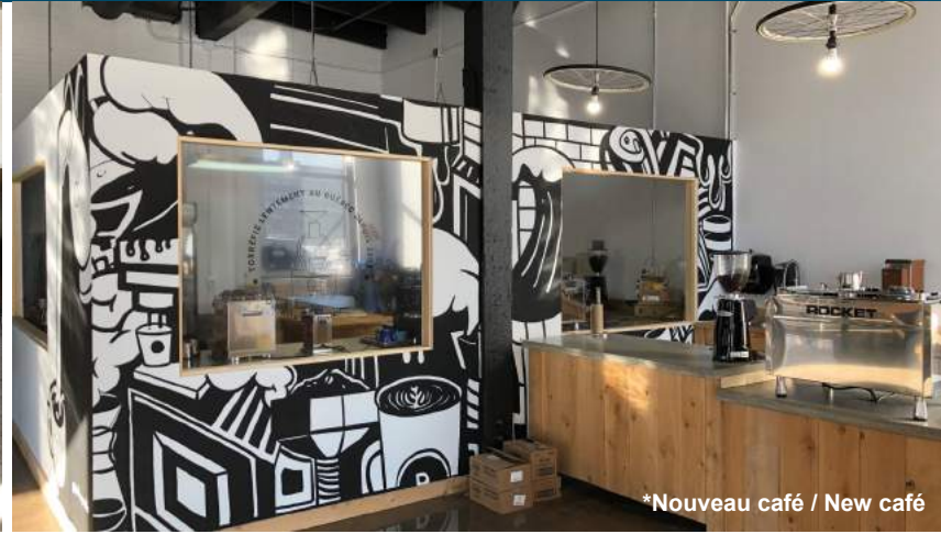
*Nouveau café / New café