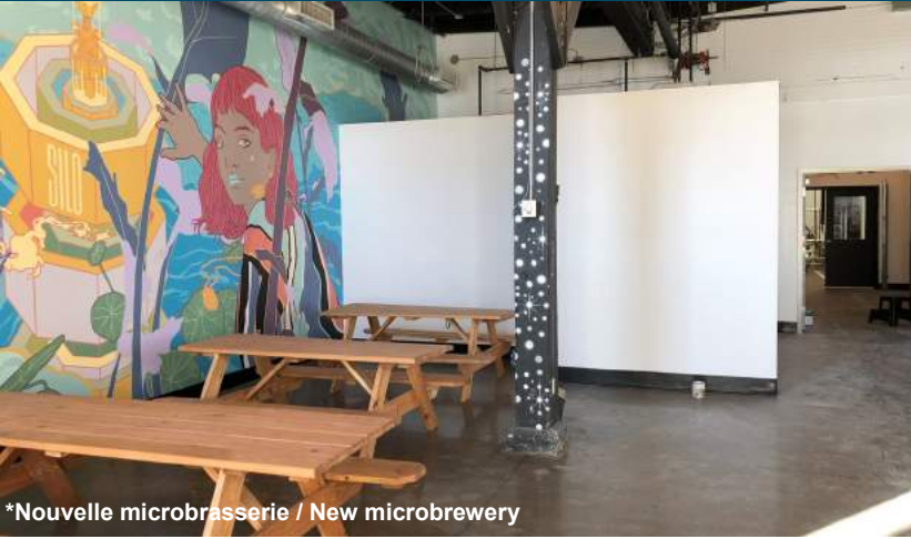
*Nouvelle microbrasserie / New microbrewery