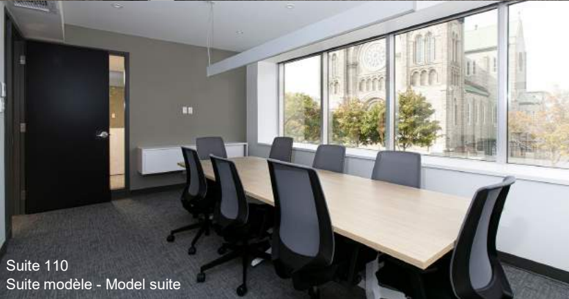
Suite 110 Suite modèle - Model suite