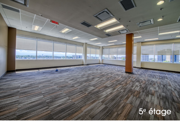
5 e étage