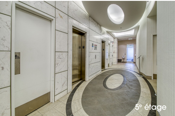
5 e étage