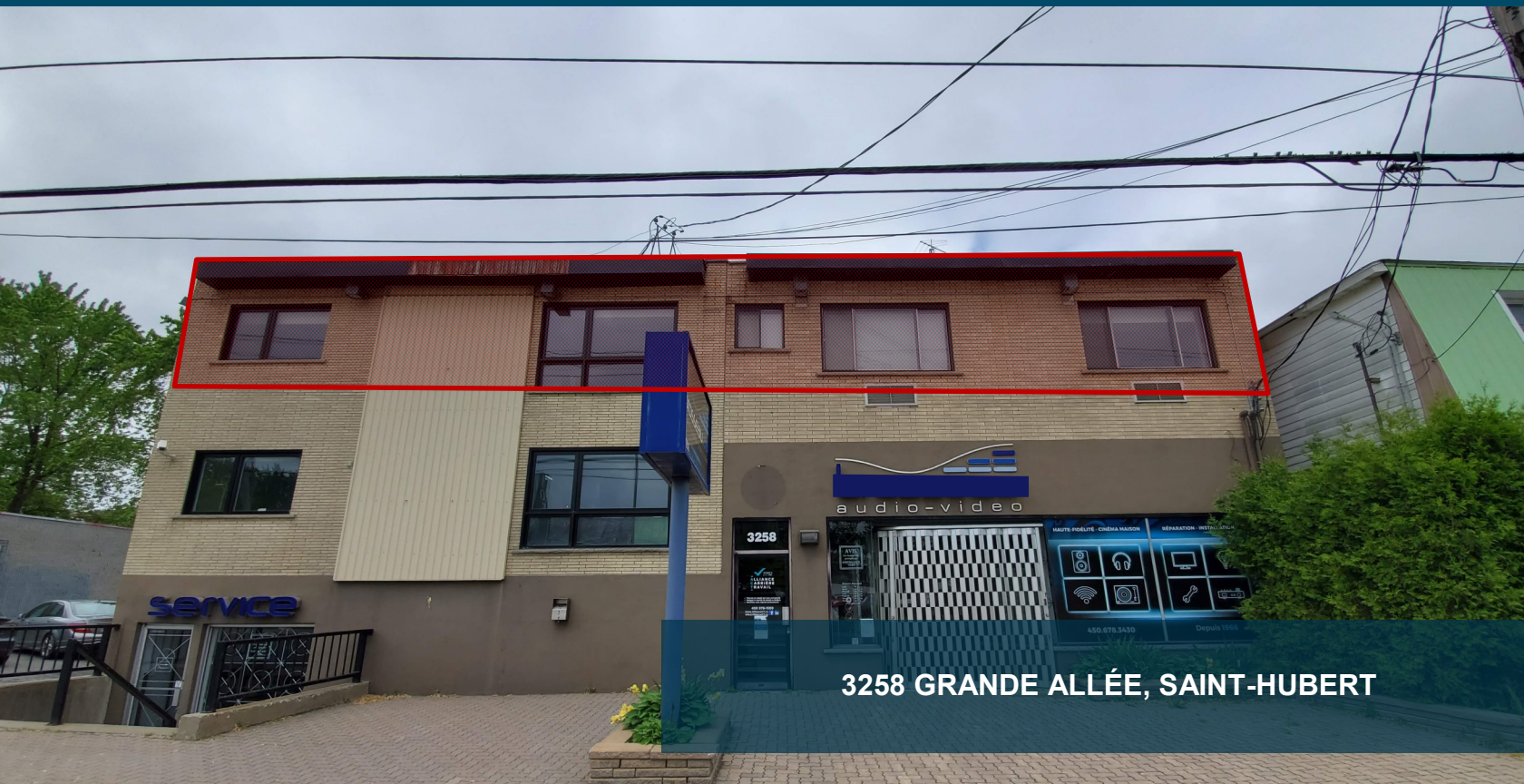
3258 GRANDE ALLÉE, SAINT-HUBERT